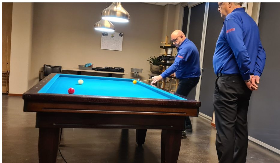
De tegenstand is dit seizoen te verwaarlozen!!!! Ook hier geen tegenstander te bekennen!