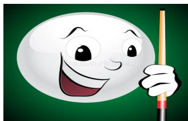
Zelfs de ballen lachen team 2 toe!